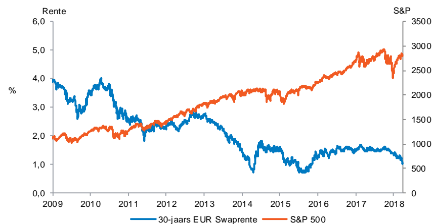
Koersontwikkeling Europese 30 jaars swaprente t.o.v. S&P 500